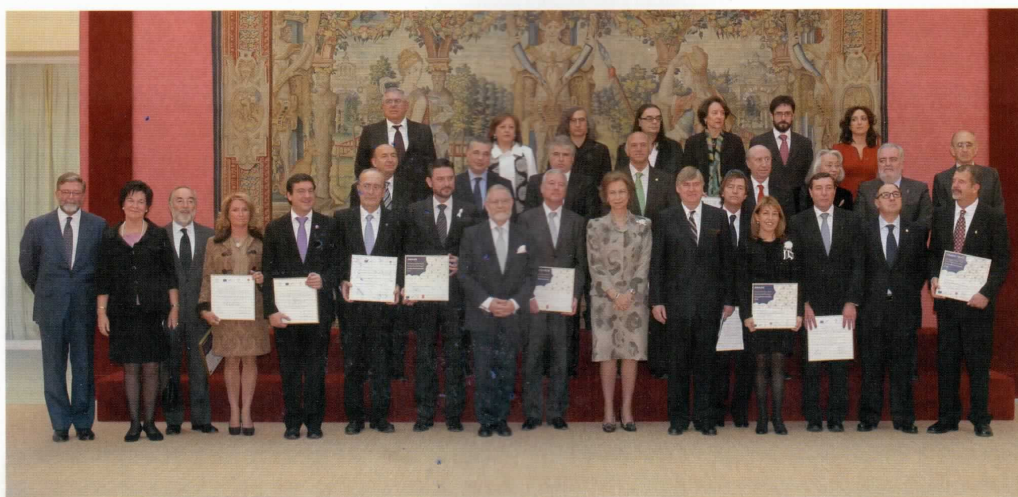
S.M. la Reina con los galardonados.