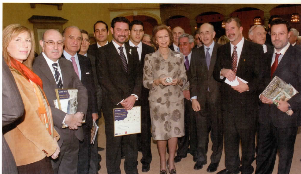
Dofia Sofía con algunos de los premiados en el Pato de los Borbones.

Su Majestad la Reina, Presidenta de Honor de Hispania Nostra, hizo entrega de los Premios Unión Europa de Patrimonio Cultural/ Europa Nostra concedidos a España en las convocatorias de 2009 y 2010, en un solemne acto celebrado el jueves 25 de noviembre en el Palacio Real de El Pardo.